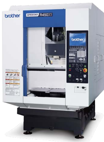
Brother Speedio avec démo i-machining.

Le centre d'usinage compact de nouvelle génération Speedio R450X1 avec table rotative accélère jusqu'à 2,2G et change ses outils dans le temps record de 0,8 seconde. Brother, le champion du monde du filetage. Des filetages M20 peuvent être taillés à une vitesse de 377 m/min. La nouvelle commande se révèle encore plus conviviale. Un écran couleur de 12,1 pouces y a été intégré, et l'utilisateur a maintenant la possibilité de définir des touches de sélection rapide en fonction de ses besoins. La nouvelle commande est capable de lire 200 blocs à l'avance, ce qui se traduit par une nette amélioration de la précision, des états de surface et de la productivité.